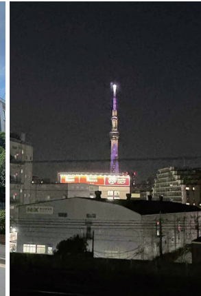
【バルコニーからスカイツリーが望めます】